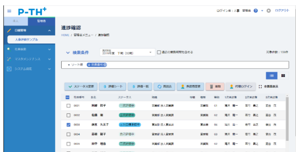
進捗確認画面イメージ